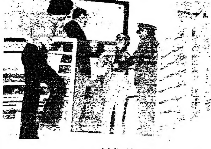
نقش قبل الدخول